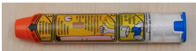
Figure 4. Adrenalina autoiniettabile - by Andrea Congiu