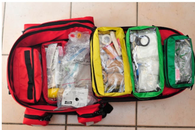
Figure 5. Spazio principale interno - by Andrea Congiu