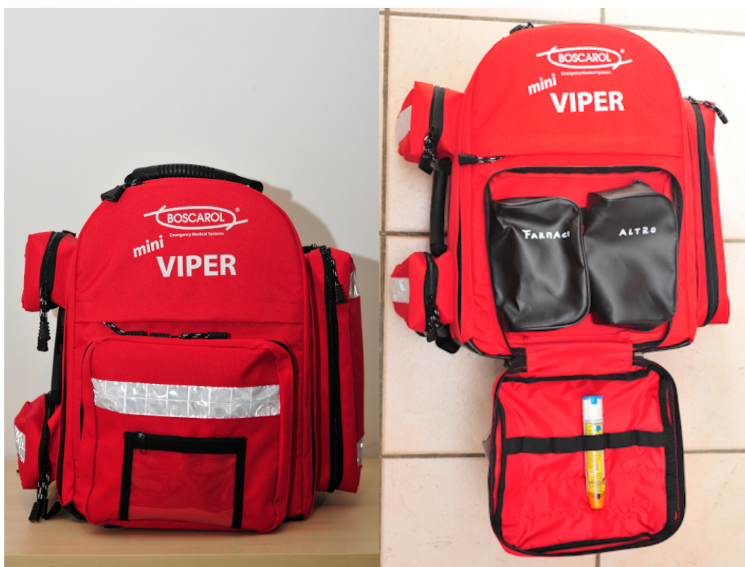
Figure 3. Tasca frontale - by Andrea Congiu