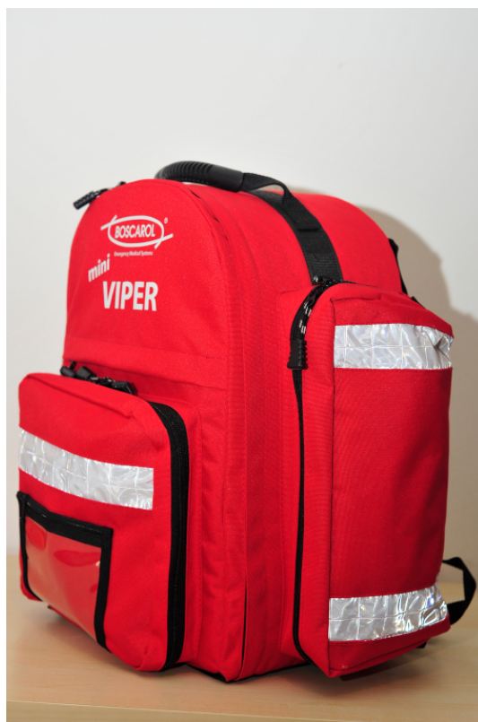
Figure 2. Tasca estrena grande a destra - by Andrea Congiu