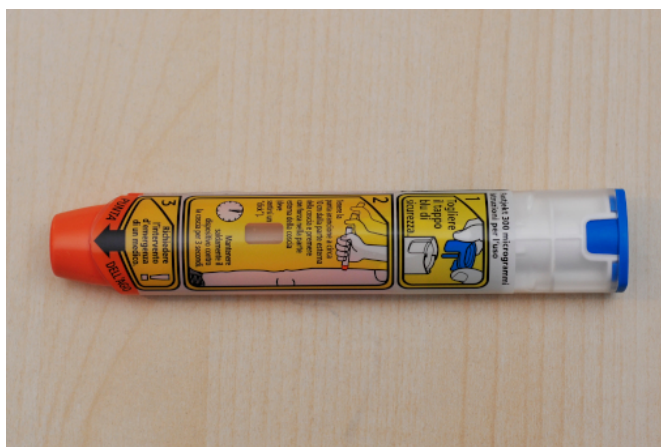
Figure 4. Adrenalina autoiniettabile - by Andrea Congiu