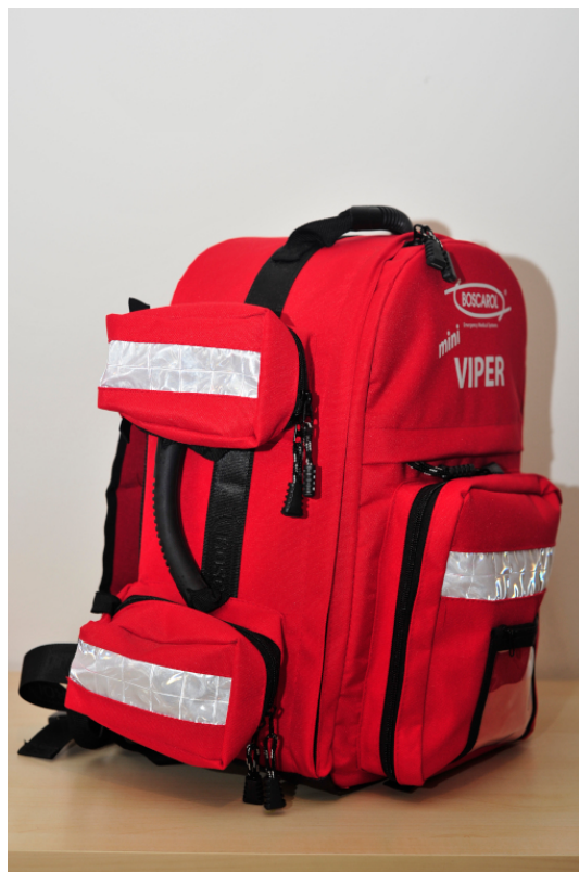
Figure 1. Tasche esterne piccole a sinistra - by Andrea Congiu