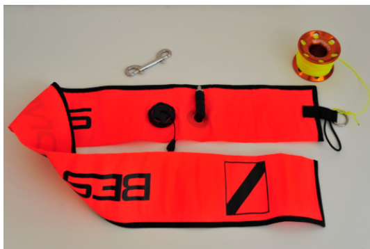
Figure 1. Pedagno - by Andrea Congiu

Il pallone, chiamato anche pedagno o SMB ( Surface Marker Buoy ) viene utilizzato principalmente come dispositivo di segnalazione in modo che il supporto di superficie sia in grado di individuare e recuperare un team di subacquei durante un'immersione o per segnalare la propria presenza alle barche. Può anche essere utilizzato come strumento di comunicazione per indicare semplicemente "siamo OK". Il tipo di immersione e diversi scenari determineranno quando e come il SMB viene mandato in superficie.